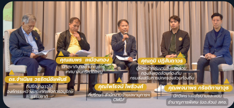
▲ เสวนาเรื่อง "เทศบาลเมือง เทศบาลนคร และ 14 จังหวัดภาคใต้ ได้ประโยชน์อะไร"

วัตถุประสงค์ : เพื่อให้เทศบาลและ 14 จังหวัดภาคใต้มีความเข้าใจเกี่ยวกับการพัฒนาเมืองสีเขียวตามแผนงาน IMT-GT และสามารถกำหนดแนวทางการพัฒนาเมืองสีเขียวได้อย่างยั่งยืน ผ่านการเสวนาใน 2 หัวข้อที่น่าสนใจ นอกจากนี้ ยังมีการประชุมเชิงปฏิบัติการเพื่อหาข้อสรุปว่าด้วยเรื่อง "กลยุทธ์ตัวชี้วัด และแผนงาน/โครงการของ 7 สาขา ตามกรอบการพัฒนาเมืองที่ยั่งยืน (Sustainable Urban Development Framework: SUDF)"